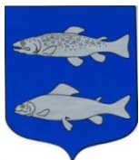
Fontaine de Vaucluse