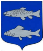
Fontaine de Vaucluse